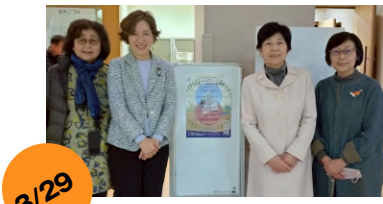
二宮町千年にのみや地球会議