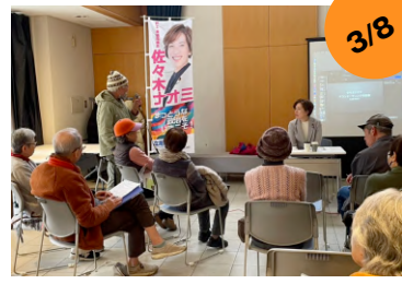
真鶴タウンミーティング