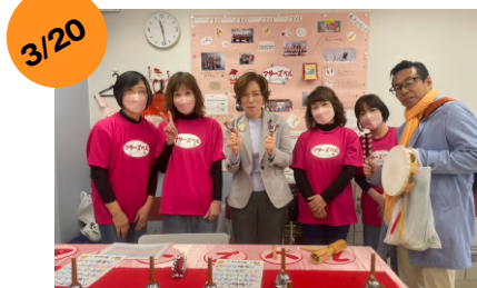
かいせい町民フェスタ