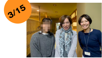
二宮町ママたちの保健室