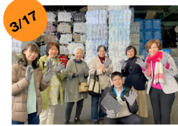
秦野市 (株) ナカノ視察