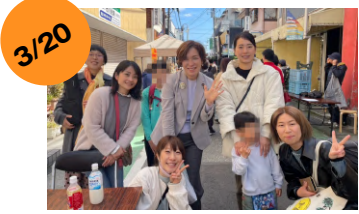
小田原市鴨宮 カモフェス