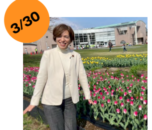
南足柄チューリップ祭り