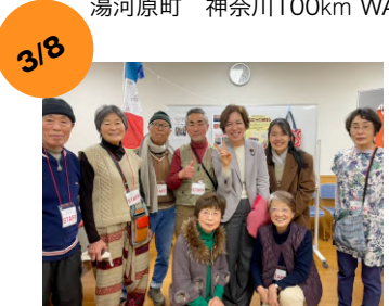
小田原市 国際交流フェスタ